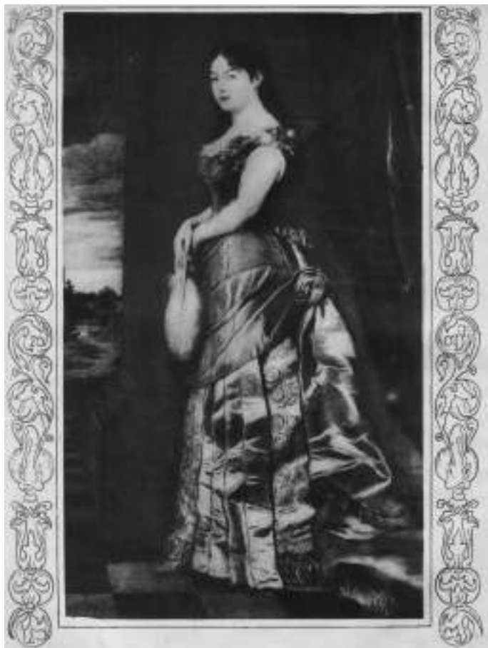
Краљица Наталија Обреновић, покровитељица Женског друштва и њених подружница од 1875. до 1900. године; извор: Жена и свет , бр. 8, Београд 1926, 4.

управе Друштва и годишњих извештаја који су штамани у Домаћици, гласнику Женског друштва (сл. 2). 11