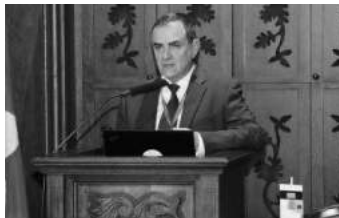
Д-р Чарлс Фаруца, директор на Националниот архив на Малта