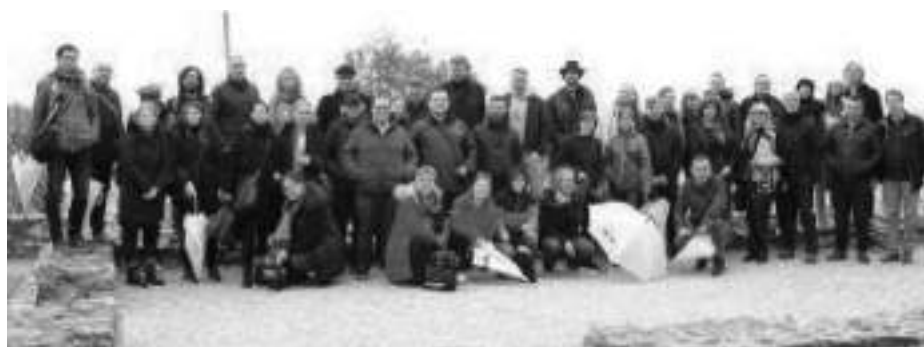
Плаошник - Охрид

На 9 ноември 2023 година, во Македонската академија на науките и уметностите во Скопје, се одржа и втората работилница во рамките на 31. Конвенција, на тема „Повторно