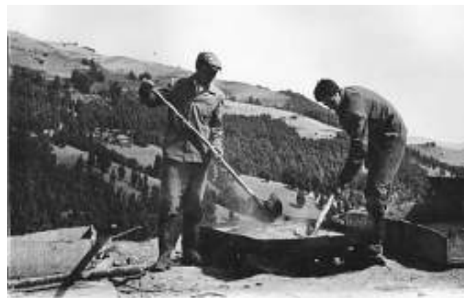
Припрема терена за узимање узорака и слање на хемијске анализе