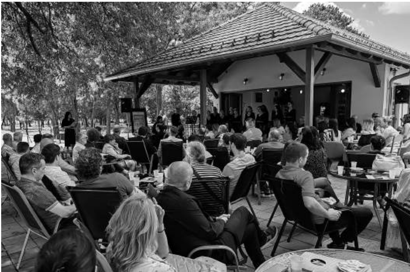
Свечаност у Љубичеву – Пожаревац, 14.6.2024.

Само за последњих двадесет година урађено је преко 200 различитих пројеката - од привођења простора намени, употреби, преко крајњег резултата чувања и обраде архивске грађе - до презентовања јавности и њеној доступности.