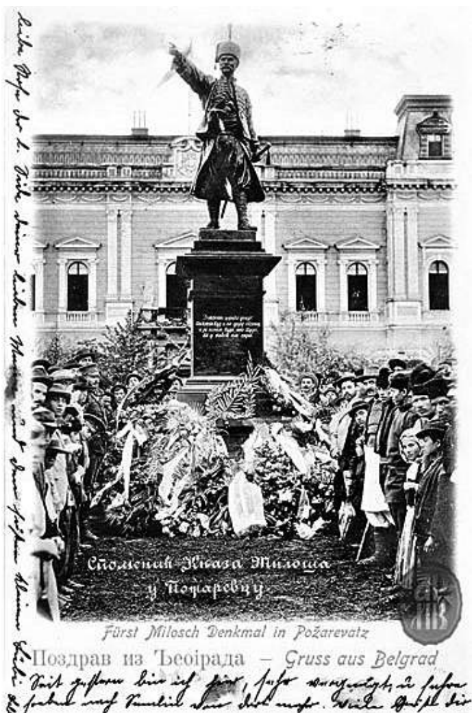
Свечаност откривања споменика кнезу Милошу 24. јуна 1898. године којој су присуствовале и чланице Пожаревачке подружине