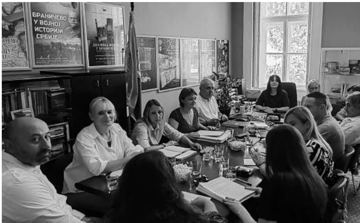
Redakcija časopisa „Zapisi – Godišnjak Istorijskog arhiva Požarevac“ Istorijski arhiv Požarevac, Požarevac, 30.8.2024.

i njihovih autorskih radova. Naš časopis već trinaest godina kontinuirano promovise arhivsku teoriju i praksu i postulate društvenih i humanističkih nauka, okupljajući veliki broj saradnika iz zemlje i inostranstva, te je naišao na odličan prijem kod stručne, naučne i šire javnosti. Svi dosadašnji brojevi časopisa nalaze se u mnogim bibliotekama, arhivima, muzejima, institutima, fakultetima..., u zemlji i inostranstvu.