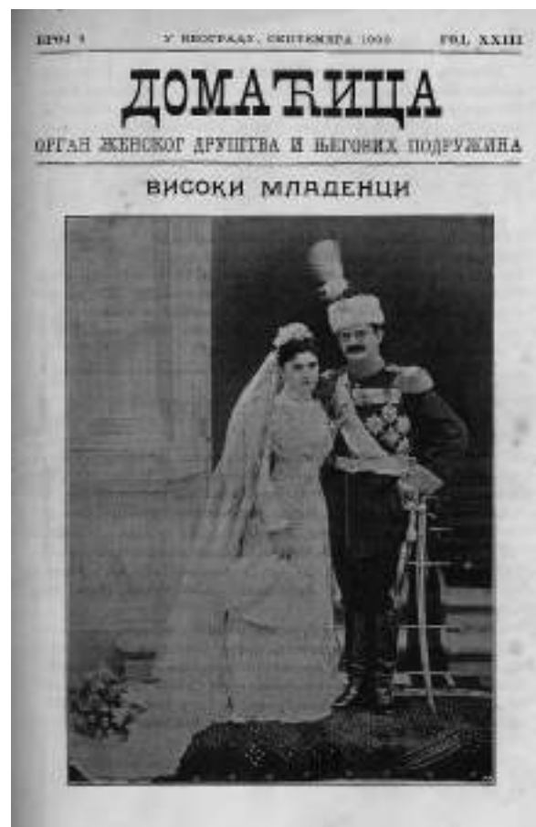
Насловна страна септембарског броја Домаћице 1900. године са фотографијом краљевског цара и покровитељице краљице Драге Обреновић; извор: Домаћица , бр. 9, Београд 1900, 297.

ствени елемент, који је свесрдно искоришћен у хуманитарном деловању, од значаја је чињеница да су најугицајније чланице биле припаднице високог друштва по положају својих супруга или очева што је додатно олакшало интеграцију у београдско друштво и обезбеђивало помоћ заједнице удружењу и њеним установама попут Раденичке школе. Подстакнута овим примером, остала удружења жена у унутрашњости Србије, која су прихватиле правила Женског друштва и постала њене подружнице, такође су започела са оснивањем својих раденичких школа. Подружнице су имале слободу самосталног одлучивања и деловања у оквиру прописаних правила, а организационо су опонашале постављени модел управе београдског