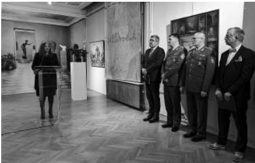
Отварање изложбе „Седам деценија посвећености – Галерија Дома Војске Србије 1953–2023”

збирке. Дела су у фонд најчешће долазила посредством откупа, а установљена је и најважнија изложбена манифестација – „НОБ у делима ликовних уметника Југославије” (одржавала се сваке пете године од 1961. до 1985), која је окупљала најзначајније уметнике са простора бивше Југославије, након које су дела откупом улазила у збирку. С друге стране, сви ликовни уметници који су били на одслужењу војног рока могли су да учествују на изложби „Војници ликовни уметници” (1961–1985), коју је организовала Галерија Дома ЈНА. Од изложбених активности и дваја се и манифестација „Оружане снаге СФРЈ и ОНО у делима ликовних уметника Југославије” (1975, 1976. и 1978). Најуспелији радови такође су одлазили у уметнички фондус Галерије.