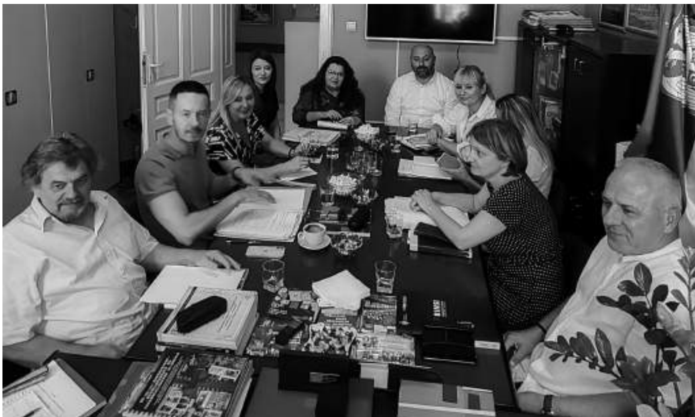
Redakcija časopisa „Zapisi – Godišnjak Istorijskog arhiva Požarevac“ Istorijski arhiv Požarevac, Požarevac, 30.8.2024.

Uređivački odbor ovog časopisa zahvaljuje svima koji su svojim zalaganjima, savetima i komentarima doprineli pripremi ovog broja. Posebnu zahvalnost dugujemo autorima koji su izdvojili svoje dragoceno vreme za pisanje naučnih članaka, stručnih radova i prikaza. Nadamo se da smo opravdali njihovo poverenje i da će saradnju sa našim časopisom nastaviti i u budućnosti. Želja nam je, svakako, da pridobijemo i nove saradnike, kako bi naredni brojevi časopisa „Zapisi – Godišnjak Istorijskog arhiva Požarevac“ bili još raznovrsniji i zanimljiviji.