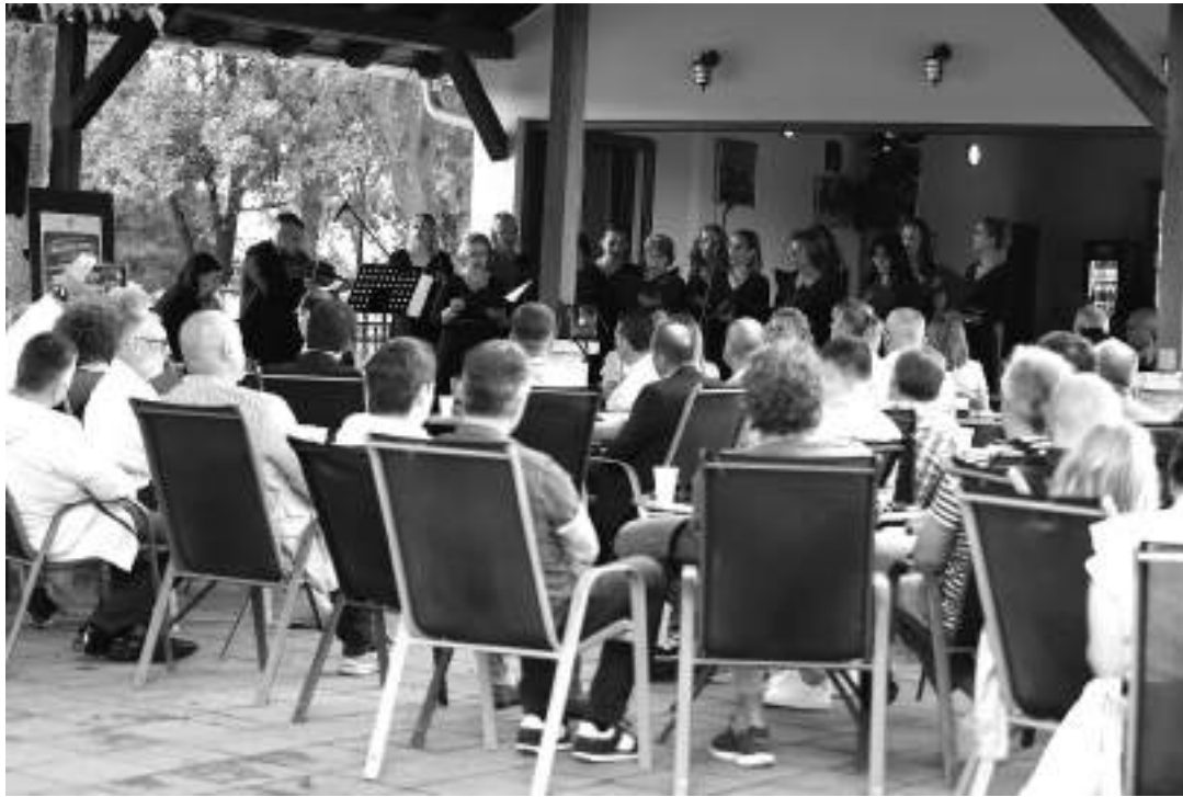
Камерни хор Одјек, Љубичево-Пожаревац, 14.6.2024.