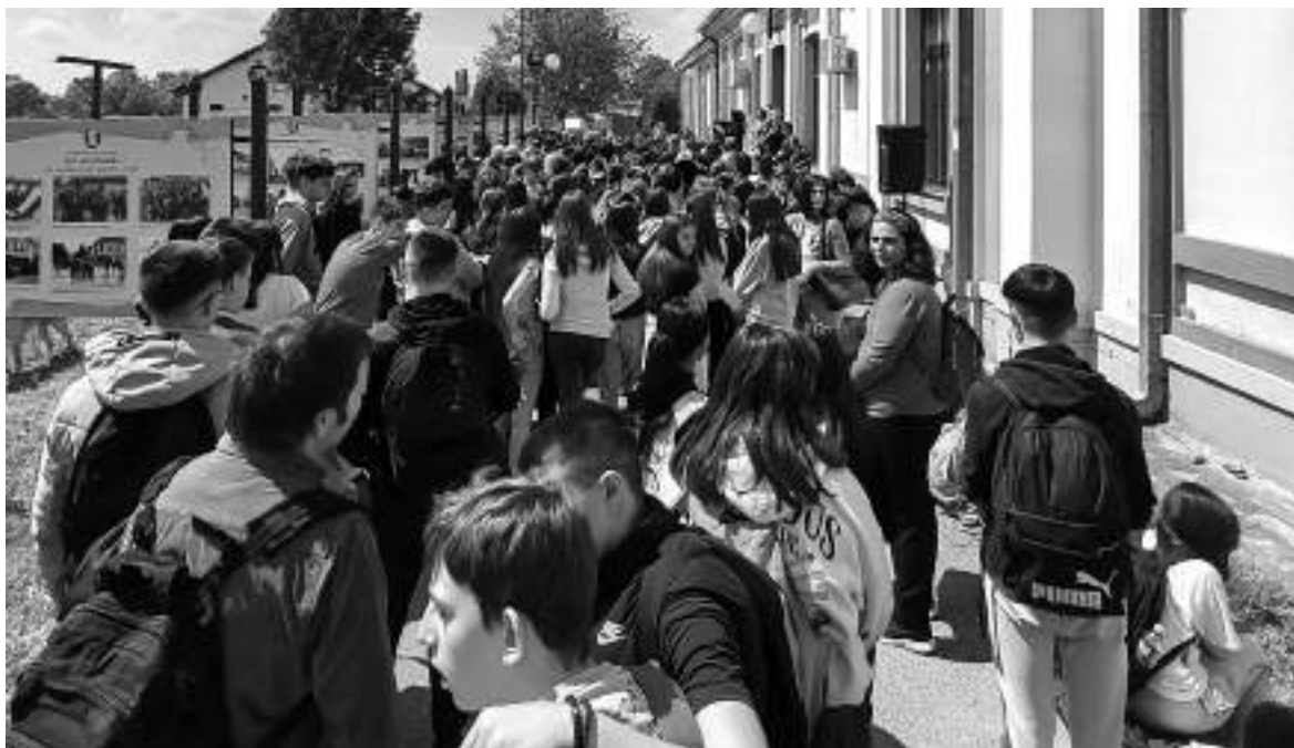
На свечаности отварања изложбе присуствовао је велики број званица