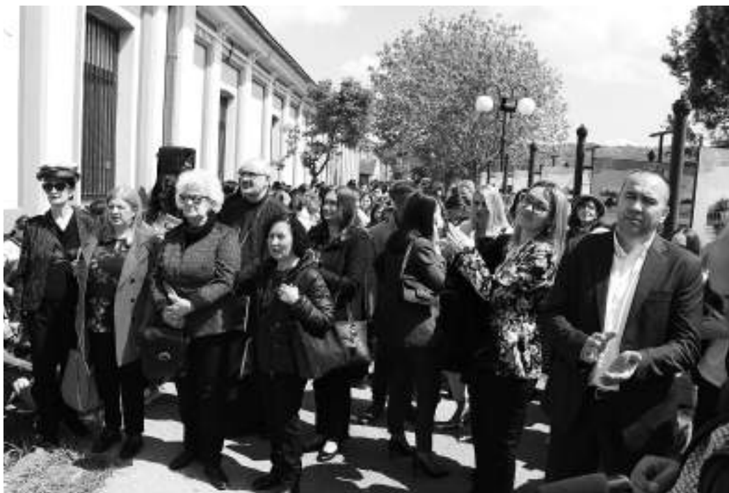
На свечаности отварања изложбе присуствовао је велики број званица