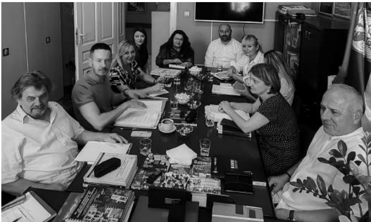
Редакција часописа „Записи – Годишњак Историјског архива Пожаревац“ Историјски архив Пожаревац, Пожаревац, 30.8.2024.