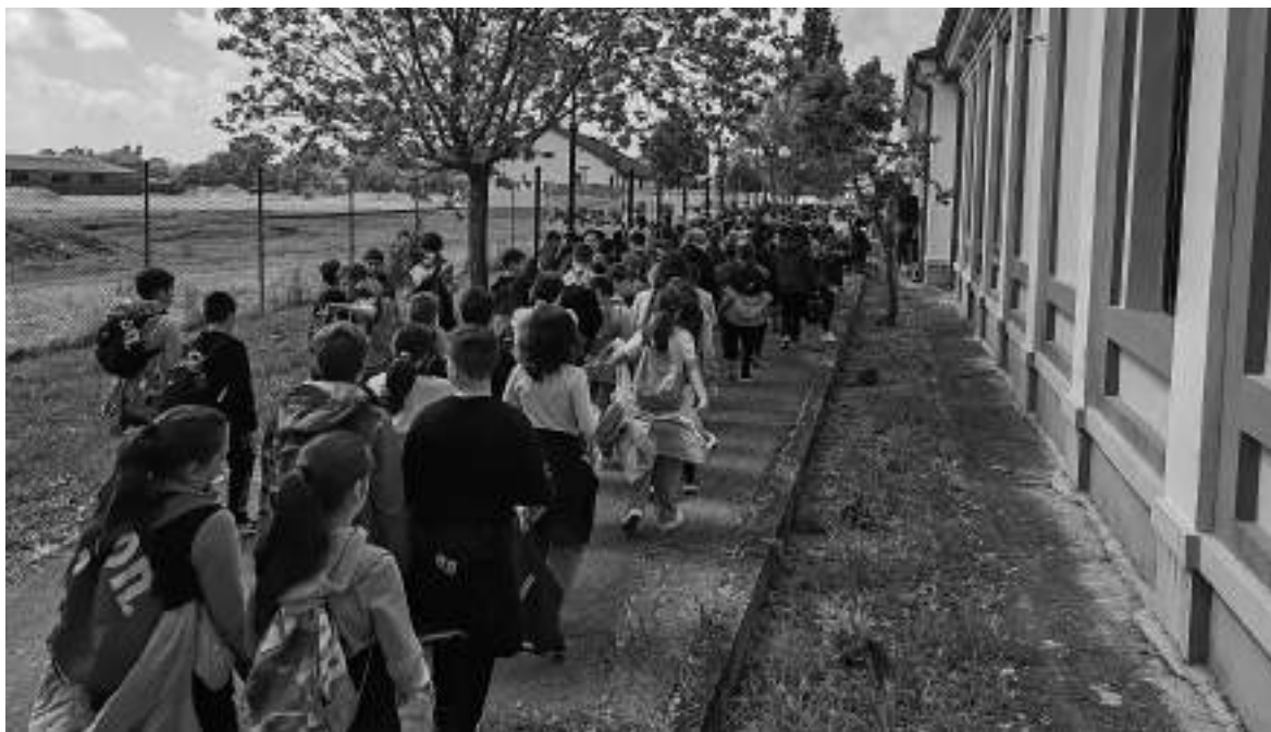
На свечаности отварања изложбе присуствовао је велики број ученика основних школа