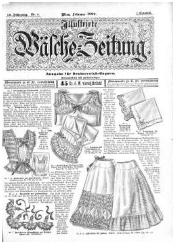
Насловна страна часописа Wäsches Zeitung , коју је Пожаревачка подружница наручивала за Раденичку школу; извор: Wäsches Zeitung , бр. 2, 1899, 9. https://anno.onb.ac.at/cgi-content/anno-plus?aid=was&datum=1899&page=13&size=45

Прва година рада обновљене Пожаревачке подружине била је више него успешна што је напоменуто и у извештају кроз запажање једне од чланица речима да „...јој (управи) благодаре на огромном послу за ову годину дана и на лепом успеху“. 75