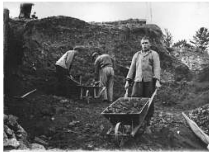
Истражни радови у околини Врања

Услови рада, као и опрема су били скромни, углавном се радило ручно истраживање, узимање и слање узорака на хемијске анализе, као што се и види на Сликама број 1 и 2.