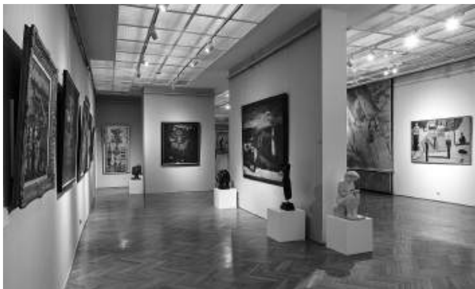
Поставка изложбе „Седам деценија посвећености – Галерија Дома Војске Србије 1953–2023”