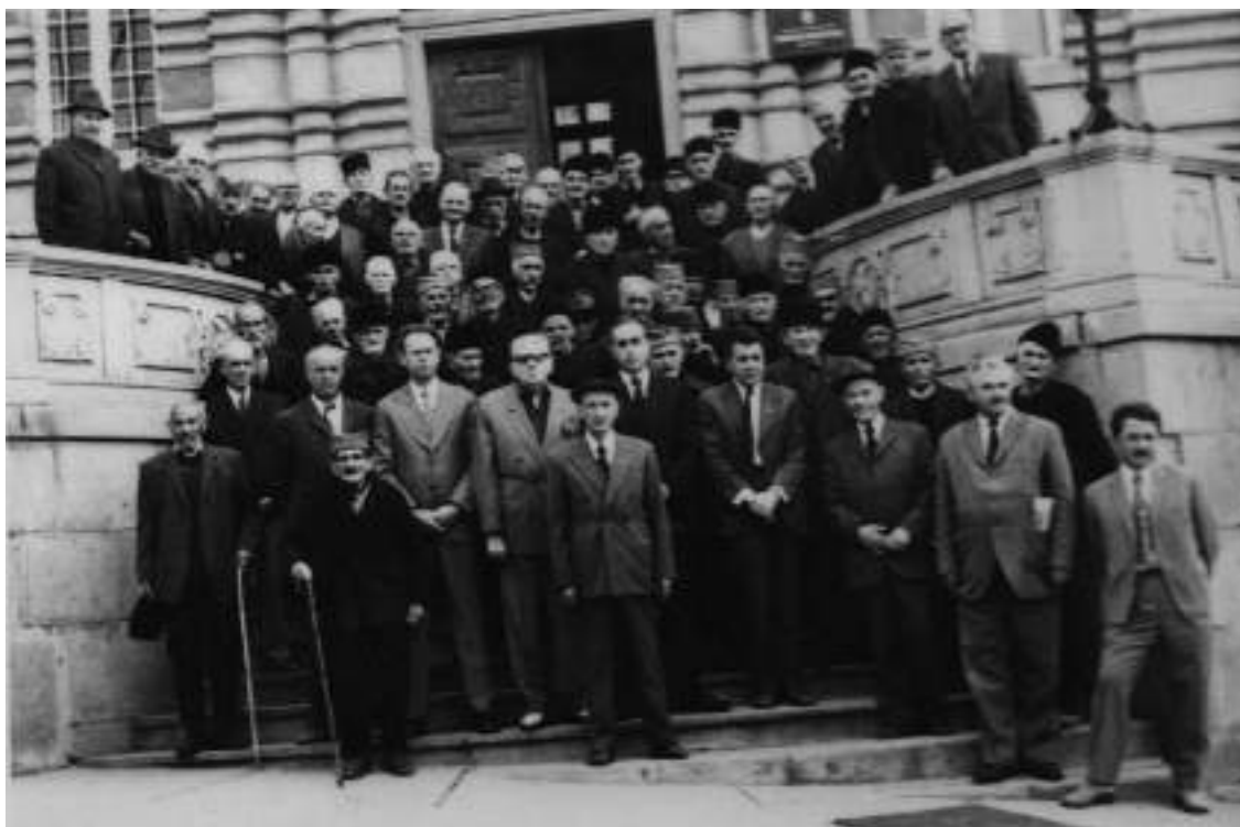
Чланови Подружнице у Врању са прославе исјрег СО-е Врање, 15. септембар 1973.