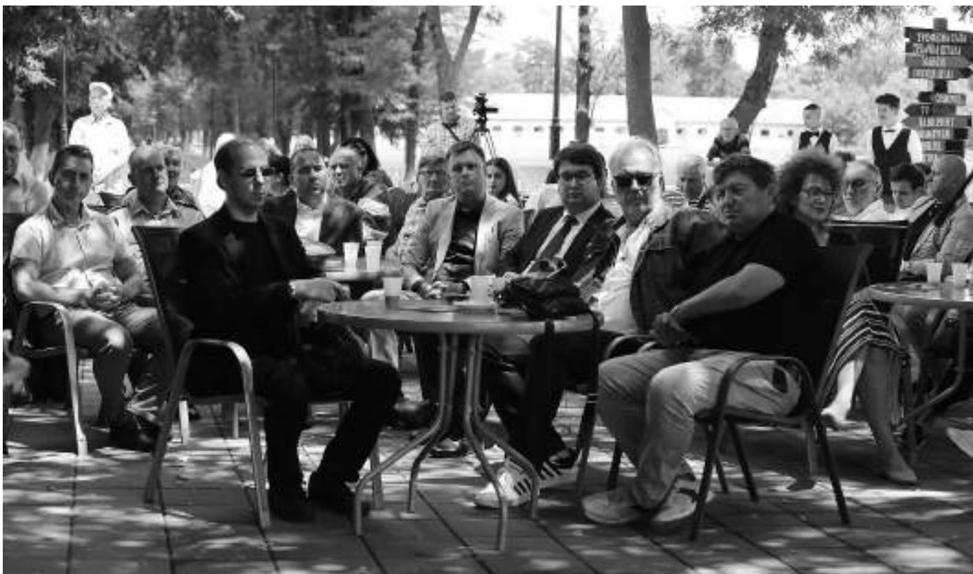
Званице и гости на свечаности у Љубичеву-Пожаревцу, 14.6.2024.