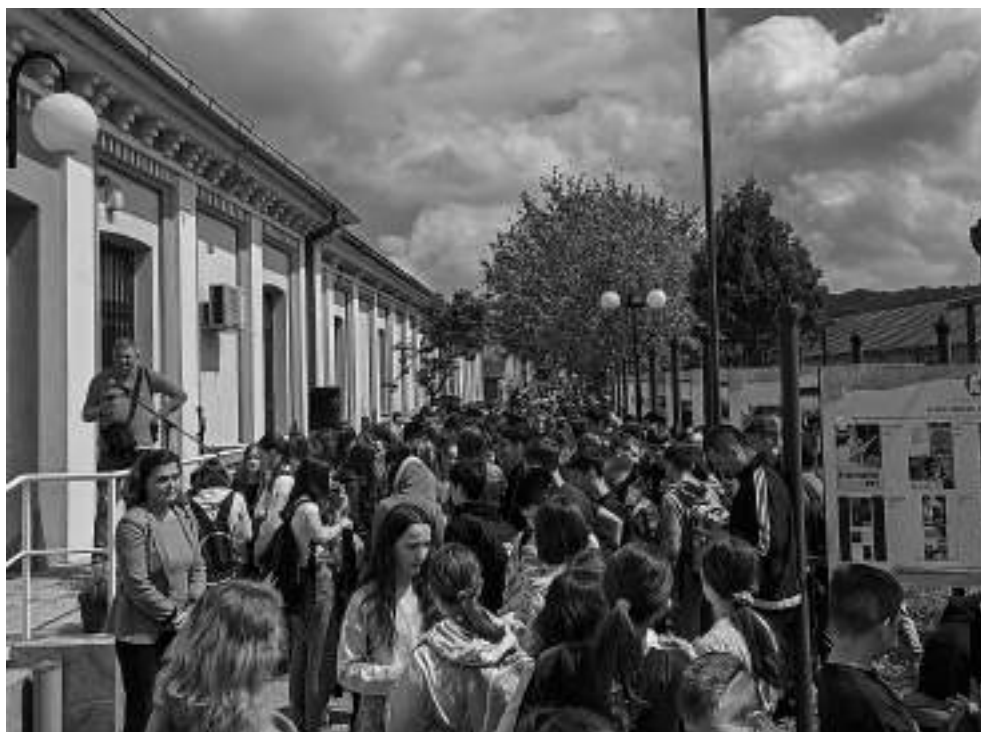
На свечаности отварања изложбе присуствовао је велики број ученика основних школа