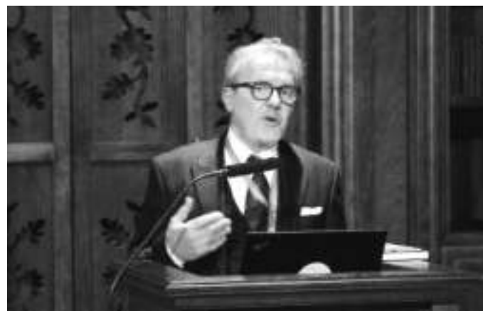
Д-р Емил Крстески, тогашен директор на Државниот архив на Република Северна Македонија

директор на Националниот архив на Малта и претседател на Европскиот огранок на Меѓународниот архивски совет, како и Биргит Кибал, претседател на ИКАРУС.