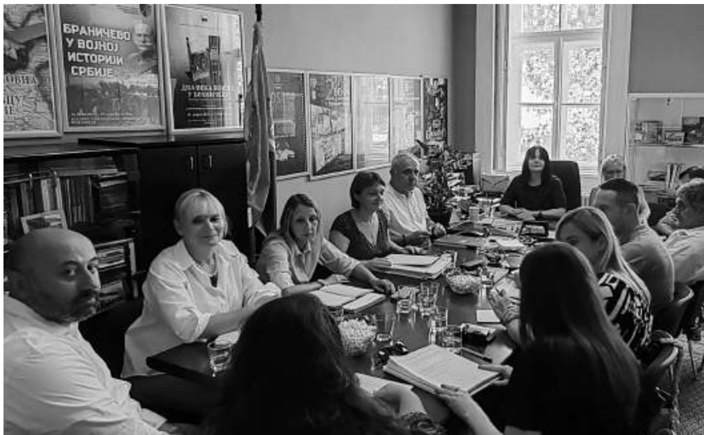
Редакција часописа „Записи – Годишњак Историјског архива Пожаревац“, Историјски архив Пожаревац, Пожаревац, 30.8.2024.

Тринаести број који је пред уваженим читаоцима, доноси укупно 26 прилога 26 аутора из 18 институција