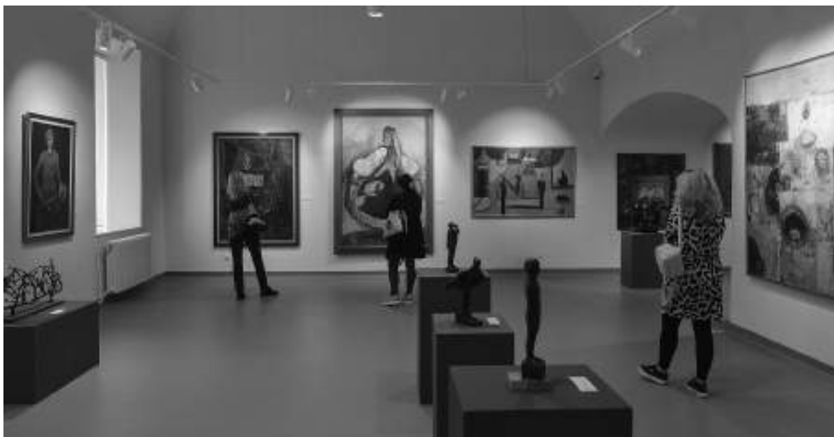
Изложба у Галерији „Нова” Народног музеја Кикинда